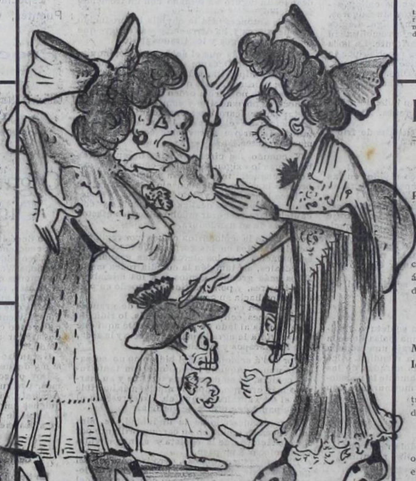
Chicharras políticas (De los dos partidos)

—Adió, si yo soy firme y constante, tanto en el amor como en la política.